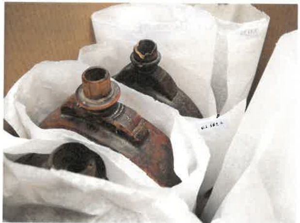
Kartondobozok és savmentes papír