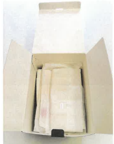
Savmentes dobozok és savmentes papír