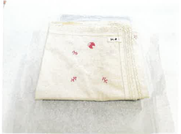
Savmentes papír és savmentes dobozok